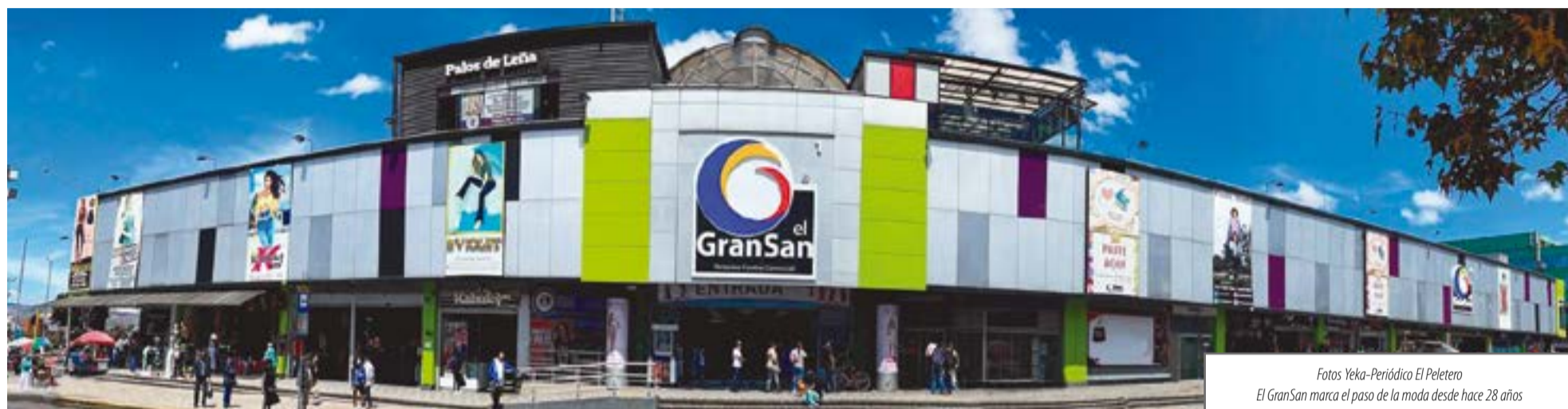
El GranSan marca el paso de la moda desde hace 28 años

Por: El Tenaz Analista del Periódico El Peletero