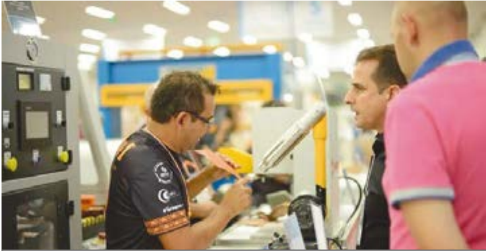
Las últimas tendencias para la industria del calzado serán expuestas, durante la Fimec 2025, en Brasil

Por: Maíara Sparrenberger Asesora de Prensa