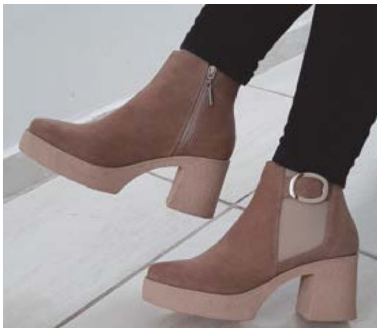
Hacer calzado es un oficio apasionante

Los demás se ponen el mejor traje: Jeans, camisetas y tenis, que encuentran en el armario. El consumo se volvió selectivo, se estrena cuando se pueda y haya disponibilidad monetaria. Por eso