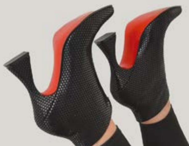
Los zapatos son prioridad en la Navidad.