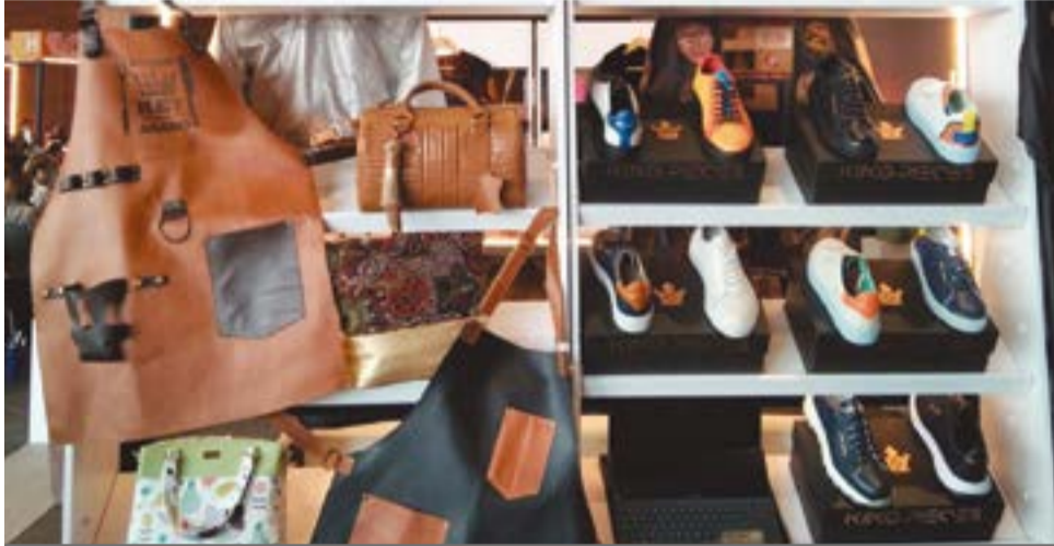
Los zapatos de moda están en el Restrepo.

Por: El Doliente Analista del Periódico El Peletero