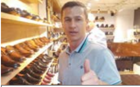
El arte de la zapatería es una profesión digna

Agilizar procesos no significa que solo debamos mirar el Sol y la Luna, sentir pasar el viento y que las manecillas del reloj nos señalen la hora y si es de noche o es de día,