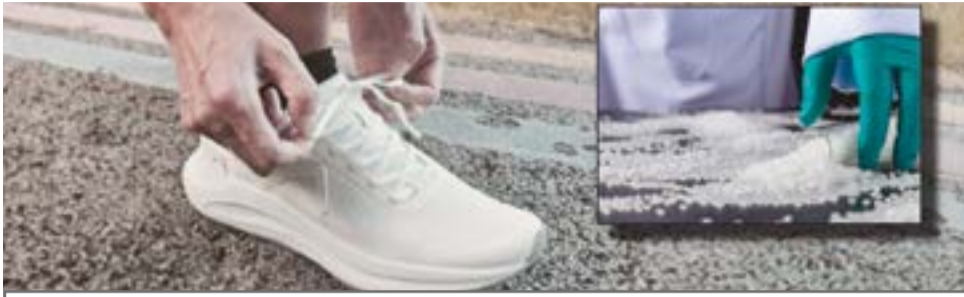
Ahora el calzado deportivo, con suelas plásticas, garantiza más rendimiento.

Por: Camilo Jaimes Tecnología del Plástico