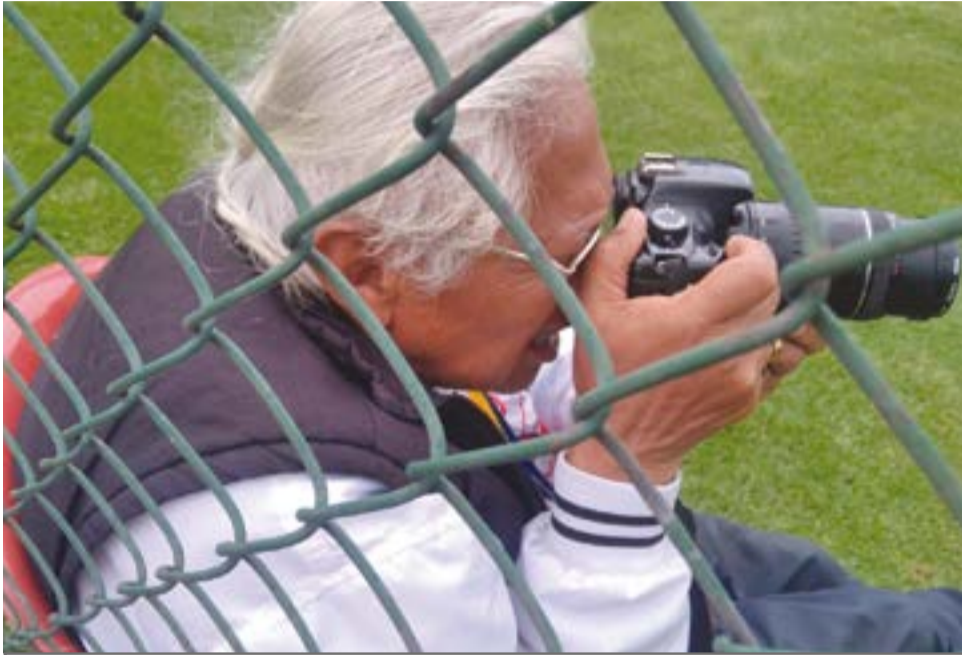
Pradita ha sido fotógrafo del Torneo de Fútbol del Olaya durante 50 años.

Por: De Taquito Analista del Periódico El Peletero