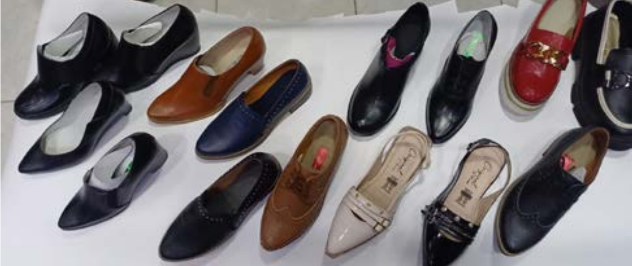
Calzado colombiano, calidad y moda.

Los industriales y comerciantes de zapatos y prendas de vestir de Colombia, mantienen las velitas encendidas, para que los negocios sean millonarios.