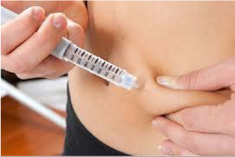
Una inyección para la salud.

E L sistema de salud en Colombia se volvió una enfermedad: quienes asisten al médico pierden tiempo y dinero; al no haber medicamentos, tienen que buscar cómo adquieren lo formulado, porque no los hay en los dispensarios, situación bastante grave; en el caso de las insulinas, son costosas y no todos tienen la opción de comprarlas en las droguerías y lugares especializados.