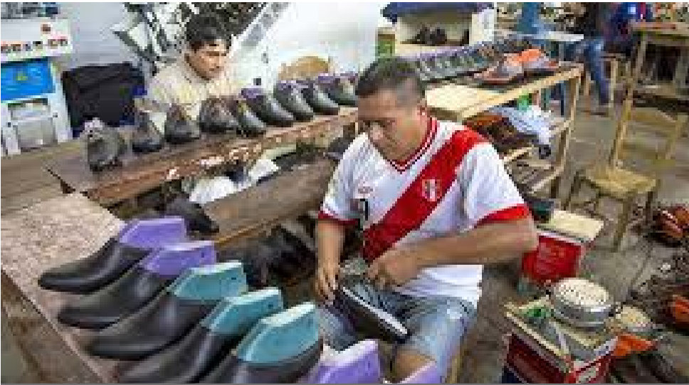
La industria del calzado de Ecuador y Perú, ganan espacios

Muchos aprendieron de los chinos: copian, producen y manejan precios.