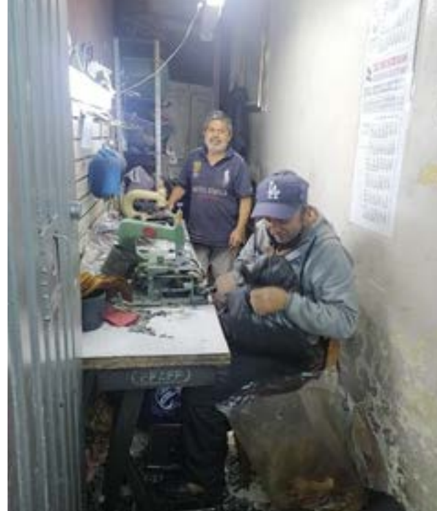
Hacer zapatos es, según los enamorados de este oficio u arte, una pasión que no cansa.

Ser empresario de fábrica de calzado, o industrial del calzado, ya es otro cuento; muchos nos creemos empresarios, o nos auto adulamos