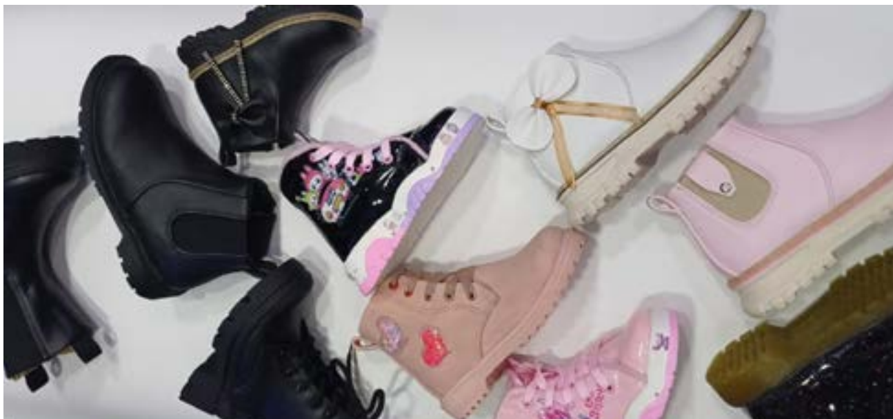
Los zapatos hechos en Colombia, especialmente en el barrio Restrepo de Bogotá, marcan la diferencia.

Por: Yoly Santis Analista del Periódico El Peletero