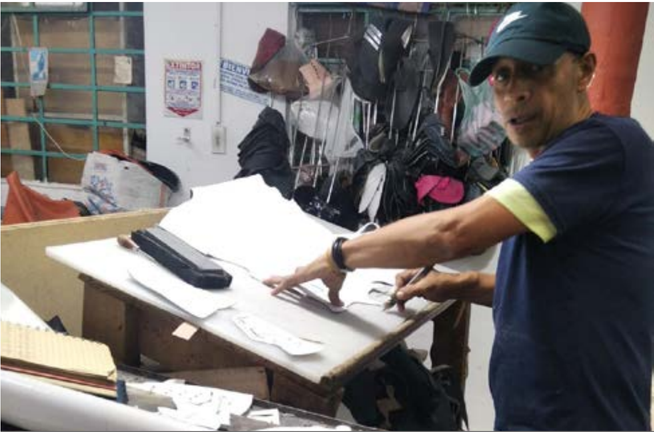
El Restrepo es un icono de la zapatería. Cielos Abiertos es moda para todos.

convenientes, incluso los fines de semana y festivos, ya que el barrio está abierto los 7 días de la semana.