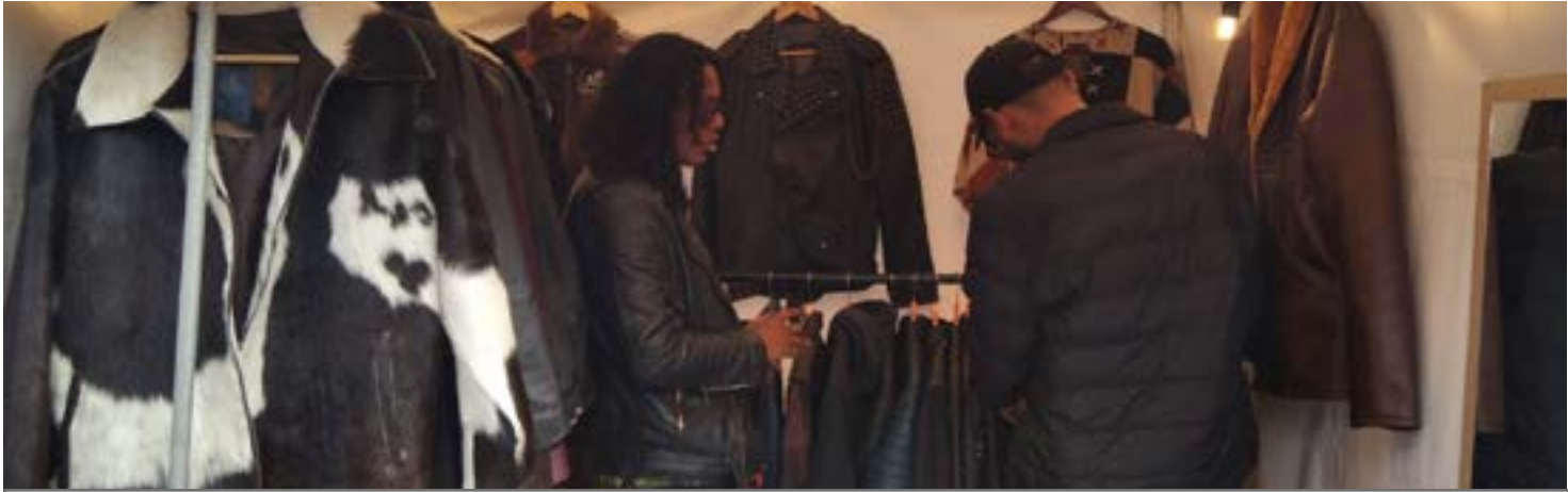
Artículos en cuero hechos con talento.

durante 3 días en el Parque de la Calle 93, al norte de Bogotá.