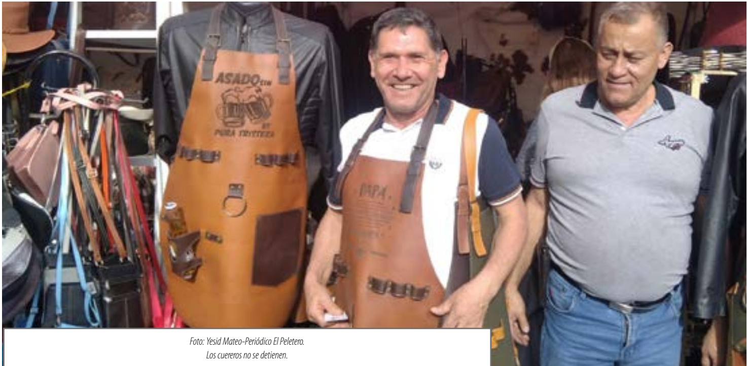
Los cueros no se detienen.

Por: Don Cuerito Analista del Periódico El Peletero